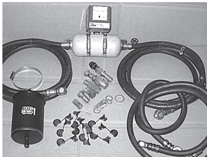
Фото 2. Комплект по переоборудованию устройства IVA-MM.

Сердцем устройства является счетчик топлива (3.3) VZO-4 или VZO-8 производства Швейцарии, фирма Aquametro или как вариант HZ-5 производства Германии, фирма Braun. И тот, и другой счетчики изначально предназначены для учета печно-